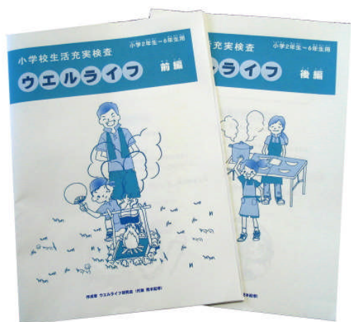
検査用紙 前編：全8ページ（質問6ページ） 後編：全4ページ（質問3ページ）

子どもたちは小学校に入学すると、「知・徳・体」の調和のとれた発達をめざして教育を受けます。小学生版ウエルライフ（学校生活充実）検査は、子どもたちが充実した学校生活を送っているかどうかを調べるために開発されました。検査では、学校生活の充実を阻害している不安やストレスの程度といったマイナスの側面と、自己を価値ある存在とみる自尊感情の育ちの程度というプラスの側面を測定し、その結果に基づいて、健全な子どもの発達のための適切な指導と助言、援助としての手がかりを先生方や保護者の皆さまに与えようとするものです。具体的には、いじめや不登校といった問題の早期発見、また充実した学校生活を阻害している不安や悩み、ストレスについての手がかり、自尊感情を高め、育てるための指導や援助の手がかりなどです。